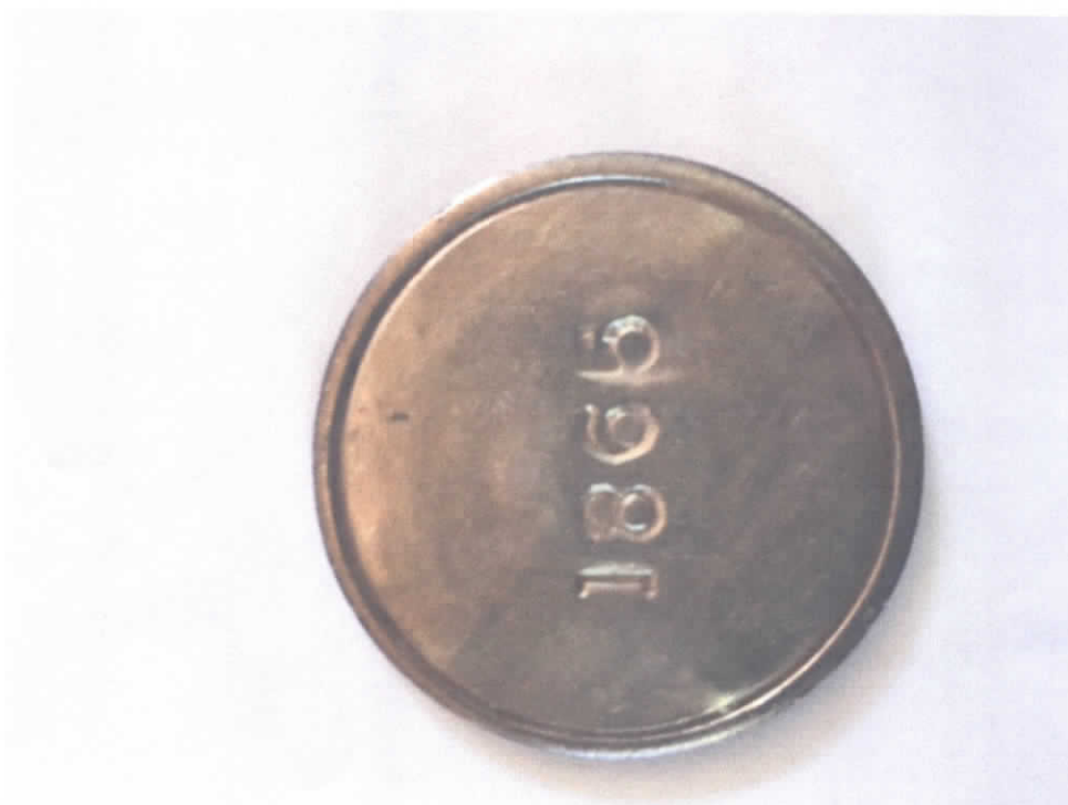
Moneda de un peso, de plata, 36 mms. de diámetro, acuñada en 1865 en Copiapó. Anverso y reverso.