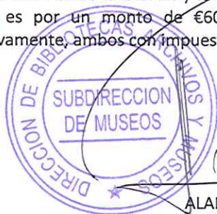
ALAN TRAMPE TORREJÓN SUBDIRECTOR NACIONAL DE MUSEOS