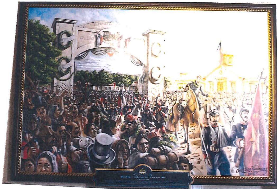
El Ejecutorio de San Juan de los Rios, 1847 G. B. 1847