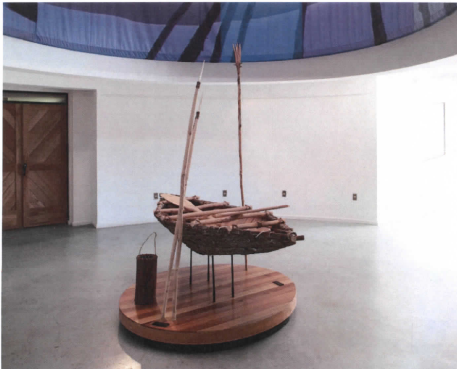
Figura 1. Réplica a gran escala de un ánan, canoa de corteza de coigüe, ubicada en el centro del hall central del MAMG. Adquirida el año 2007.

Ánan , la canoa de corteza de coigüe es tal vez el objeto más representativo de la cultura originaria de los canales de Tierra del Fuego. Ya sea que se trate de las tempranas poblaciones canoeras del archipiélago, o de la más reciente cultura yagán, reconocida en tiempos históricos y presente hasta nuestros días, la canoa de corteza define la presencia humana en la región. Por este motivo es que la exhibición permanente del MAMG, en su proceso de renovación desarrollado entre los años 2006 y 2008, puso en el centro de su guión y del museo, a la canoa como el elemento central. Situando en el centro del hall central una réplica a gran escala de la canoa de corteza, no solo se buscó concretar una adecuada propuesta estética, sino que se buscó articular el relato completo del guión en torno al modo de vida canoero y la metáfora del viaje que éste evoca.