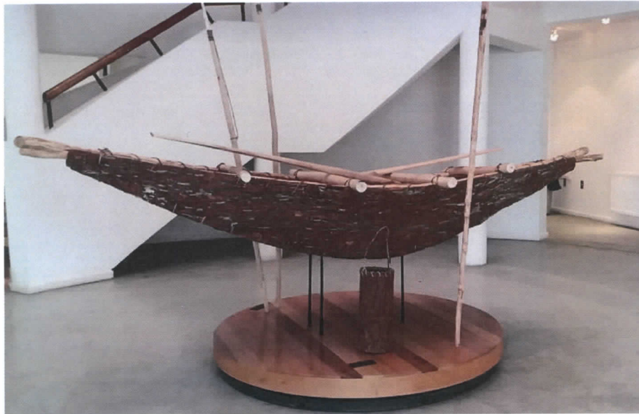
Figura 2. La nueva réplica a gran escala de un ánan, canoa de corteza de coigüe. Ubicada en el centro del hall central del MAMG, del mismo modo que la canoa anteriormente utilizada (adquirida el año 2007)

Como se indicó, la canoa de corteza es uno de los elementos principales del habitar en el territorio por las poblaciones originarias. De hecho las investigaciones arqueológicas desarrolladas nos confirman la presencia de poblaciones canoeras en la zona del canal Beagle desde 6.500 años antes del presente 1 . Y si bien no se puede establecer que estas poblaciones sean el mismo pueblo yagán que encontramos desde tiempos históricos, si se