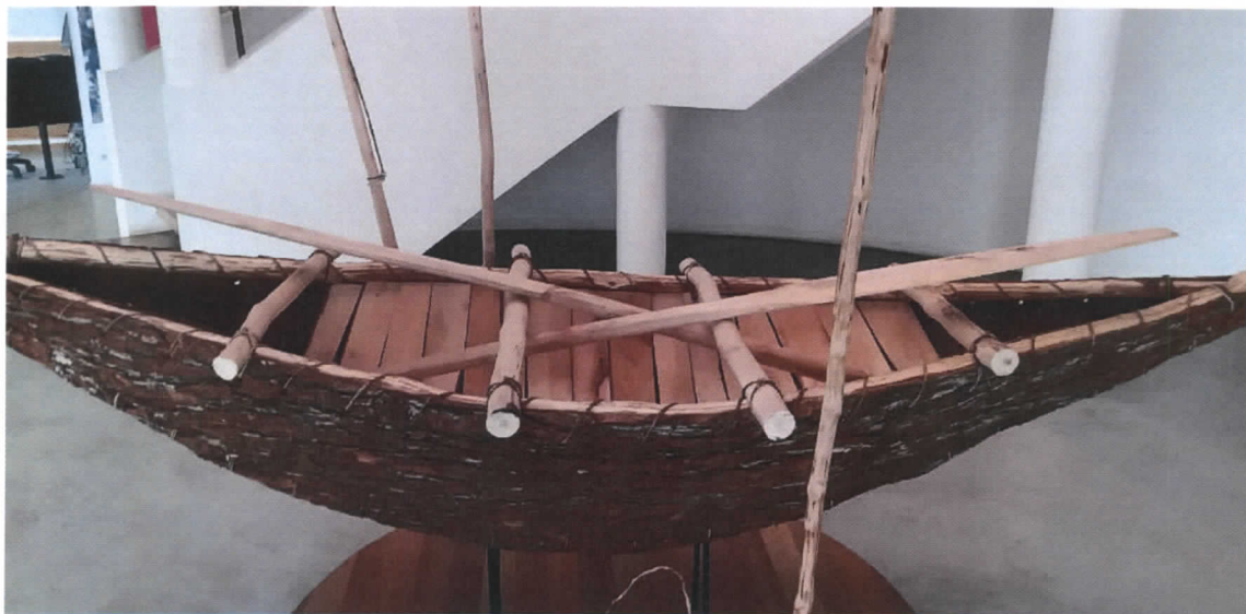
Figura 6. Vista superior lateral de la canoa de corteza. Se aprecian los remos y sus cuadernas.