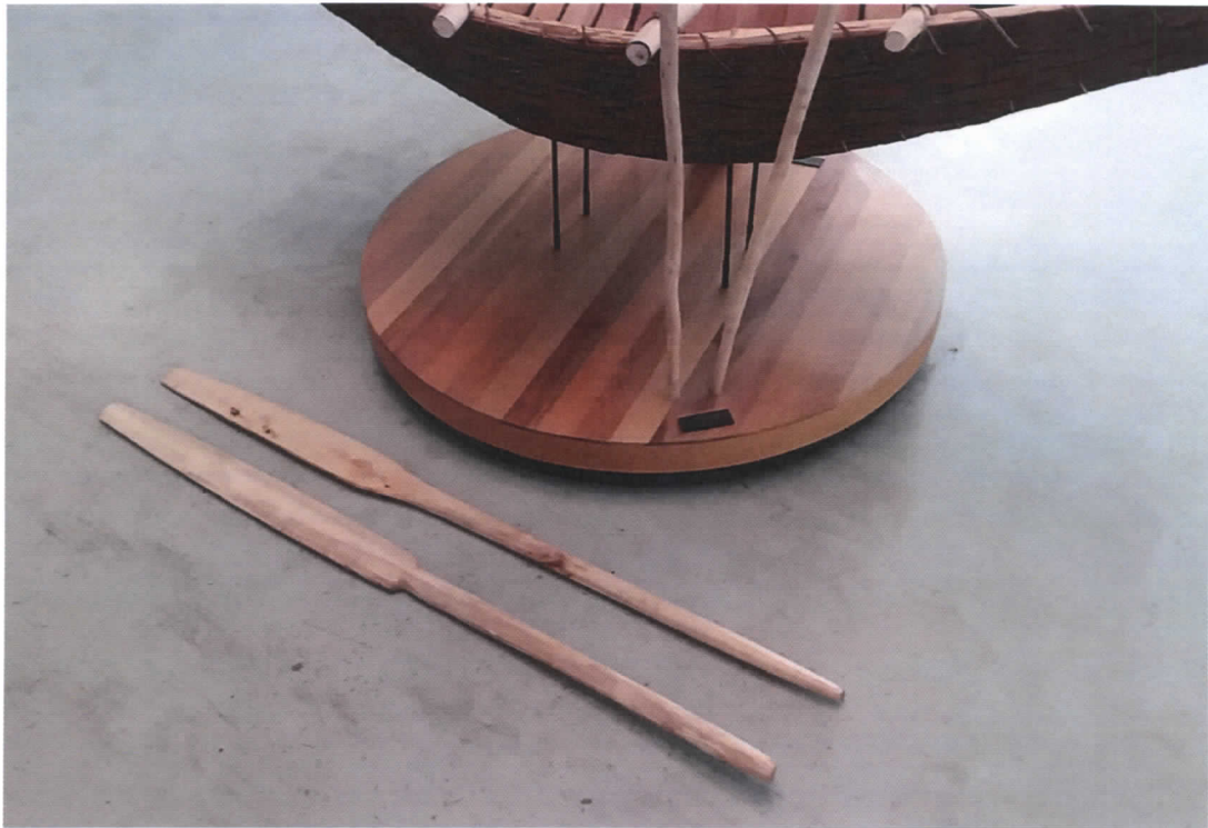
Figura 5. Se aprecian los dos api o remos que acompañan el ánan o canoa de corteza.