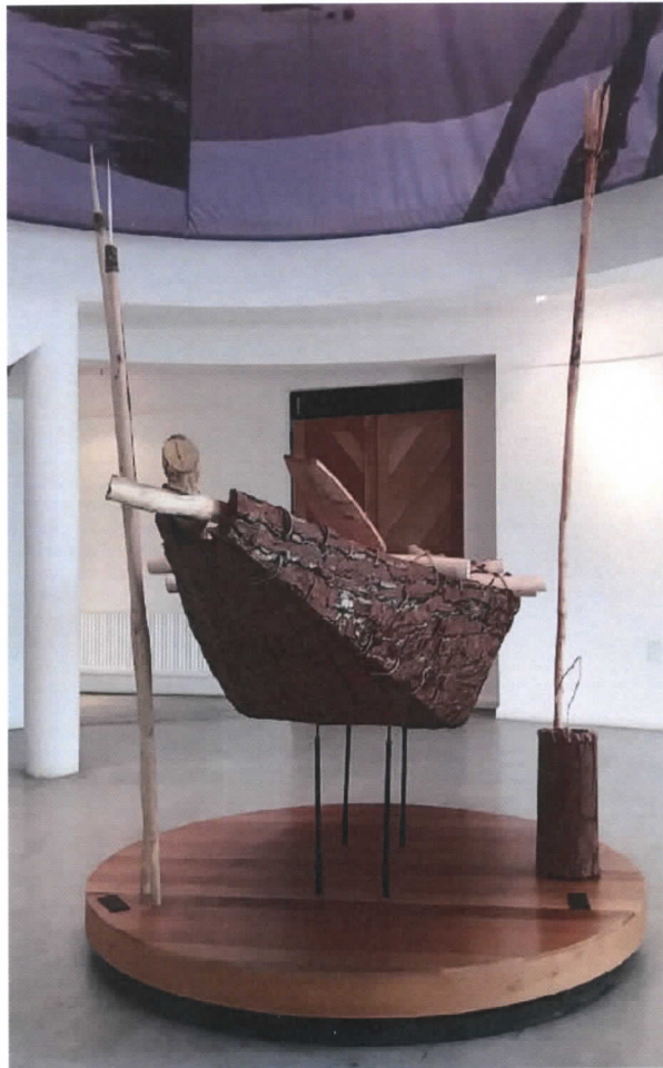
Figura 3. El nuevo Ánan, ya instalado sobre la plataforma de exhibición permanente y su juego de herramientas.

Cabe consignar que este nuevo ejemplar encargado es de un tamaño notoriamente más grande que la canoa encargada el año 2007 y que hasta ahora se encuentra en la exhibición. Las medidas de la canoa “antigua” son de: 267 cms. de estora (largo), 81 cms. de ancho, 31 cms. de puntal (calado o altura). Es decir, la nueva canoa tiene más de 30 centímetros más de eslora que la ya existente y es más alta y robusta. Igualmente cabe consignar que su cortaza se encuentra en un excelente estado y se puede apreciar que es de mejor calidad que la corteza utilizada en la canoa antigua. Esto es muy factible, dado la obtención de la materialidad en la naturaleza de manera directa.