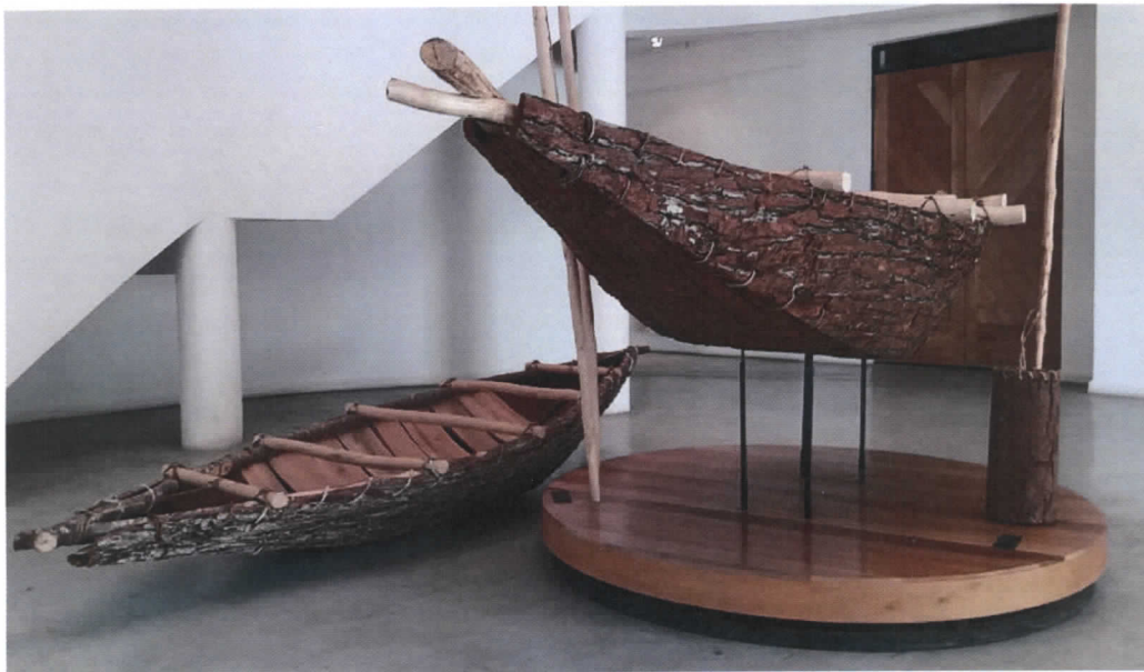
Figura 4. Se observa la nueva canoa sobre el pedestal y la antigua sobre el suelo. La diferencia de tamaños y de la calidad de la corteza es evidente.

Los restantes elementos que componen el “juego” de la canoa, son los siguientes objetos: